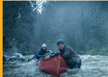
F 2024, R: Franck Dubosc, D: Franck Dubosc, Laure Calamy, Benoît Poelvoorde u.a. 114 Min., FSK 16, Erstaufführung

Die wunderbar absurde, schwarze Komödie ist eine unterhaltensreiche Mischung aus winterlichem FARGO und EBERHOFER-Dorfkrimi – mit skurrilen Figuren, sich überschlagenden Wendungen, viel Honig und einer Swingerclubnacht als fadenscheiniges Alibi.