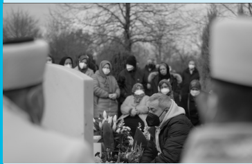
D 2025, Marcin Wierzchowski, 132 Min., FSK 6, Erstaufführung