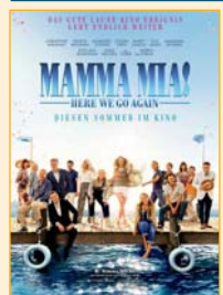
B/R: Ol Parker. D: Meryl Streep, Pierce Brosnan, Amanda Seyfried. USA 2018, 114 Min., FSK: ab 0, sechste Woche!