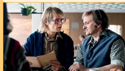
R: Andreas Dresen. D: Alexander Scheer, Anna Unterberger, Axel Prahl, Thorsten Merten, Eva Weiborn. Deutschland 2018, 128 Min., FSK: ab 0, Erstausführung!

Reservierung: 0521 5576777 und www.lichtwerkkino.de