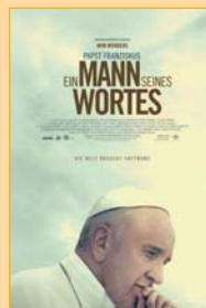
R: Wim Wenders. Deutschland 2018, 96 Min., FSK: ab 0, elfte Woche!