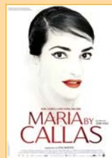
2017, 118 Min., FSK: ab 12, 15. Woche!