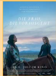
WOMAN WALKS AHEAD B/R: Susanna White. D: Jessica Chastain, Michael Greyeyes, Sam Rockwell, Ciarán Hinds. USA 2017, 103 Min., FSK: ab 12, achte Woche!