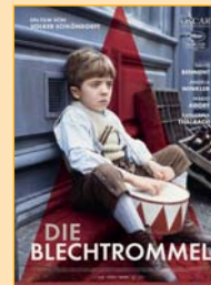
B/R: Volker Schlöndorff. D: David Bennent, Angela Winkler, Mario Adorf, Daniel Olbrychski, Katharina Thalbach. BRD 1979, FSK: ab 16.

Mo 31. August 19.00 | 40 JAHRE: DIE BLECHTROMMEL Danzig 1927. Der äußerst frühreife und hellwache Oskar ist gerade erst drei Jahre alt geworden. Und doch ist ihm bereits klar: Das kleinbürgerliche Leben der Erwachsenen kann und will er so nicht akzeptieren. Er hört einfach auf zu wachsen. Leidenschaftlich protestiert der anarchische Zwerg fortan auf seiner Blechtrommel gegen fanatische Nazis und deren feige Mitläufer. Immer wieder erhebt er seine Stimme gegen die muffigen Spießer der Weimarer Republik und deren derbe Erotik. So schrill, bis Glas springt. Erst als nach dem Krieg eine menschlichere Zeit beginnt, beschließt Oskar wieder am Leben teilzunehmen und wächst weiter. Die brilliant inszenierte Verfilmung des Romans von Günter Grass wurde mit zahlreichen Preisen ausgezeichnet, u.a. 1979 in Cannes mit der Goldenen Palme für die Beste Regie und 1980 mit dem Oscar für den Besten Ausländischen Film. Zum 40. Jubiläum des Oscar-Gewinns kommt das Meisterwerk zurück auf die Leinwand - restauriert und mit komplett überarbeitetem Bild und Ton.