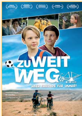
R: Sarah Winkenstette. D: Yoran Leicher, Sobhi Awad, Anna König, Andreas Nickl. Deutschland 2019, 92 Min., FSK: ab 0, empfohlen ab 8, KinderKINO: 6,50 € Eintritt für Groß und Klein!

Da sein Heimatdorf einem Braunkohletagebau weichen soll, müssen Ben (12) und seine Familie in die Stadt umziehen. In seiner neuen Schule ist er erst mal der Außenseiter. Und auch im neuen Sportverein laufen die Dinge für ihn nicht wie erhofft. Zu allem Überfluss gibt es noch einen weiteren Neuankömmling an der Schule: Tariq (11), Flüchtling aus Syrien, der ihm nicht nur in der Klasse die Show stiehlt, sondern auch auf dem Fußballplatz ein Konkurrent ist. Wird Ben im Abseits bleiben – oder hat sein Konkurrent doch mehr mit ihm gemeinsam als er denkt?