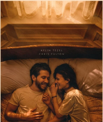
FALLING INTO PLACE